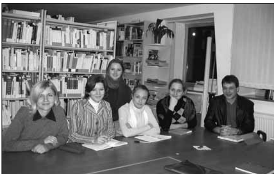
Фото 3. Слушатели курсов “Экономический немецкий” и “Studienkolleg” Института немецких исследований 2005–2006 гг.