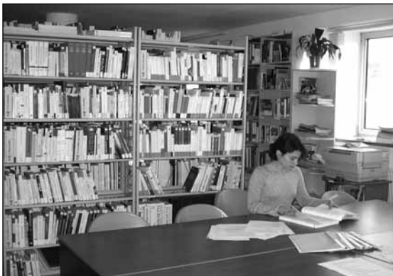
Фото 2. Библиотека Центра международных исследований.

ТК: Да, библиотека нашего Центра располагает ресурсами на немецком, английском, французском и шведском языках по таким отраслям, как право, экономика, история, политология, философия и др. Ее совокупный фонд насчитывает более 8000 единиц хранения: книг, иностранной периодики, видео- и аудиоматериалов, CD- и DVD-ROM'ов. Услуги библиотеки — выдача литературы, консультации в поиске и подборе информации — являются полностью бесплатными.